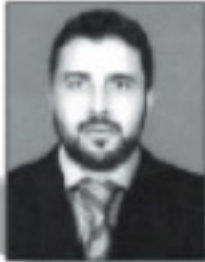
إشراف : سعد للنصوري